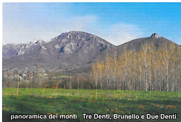
panoramica dei monti Tre Denti, Brunello e Due Denti

Per il Monte Brunello prendete il sentiero sul crinale di sinistra, al Col Mariun. E' una salita impegnativa, non tanto per le difficoltà tecniche quanto per la scarsa segnalazione offerta unicamente dalle solite tacche di vernice blu abbondantemente e disordinatamente distribuite. Sul percorso non c'è alcuna deviazione solo passaggi fra contrafforti rocciosi non difficili da superare e vegetazione molto abbondante, specialmente foglie secche l'incertezza del camminamento. Fate attenzione !